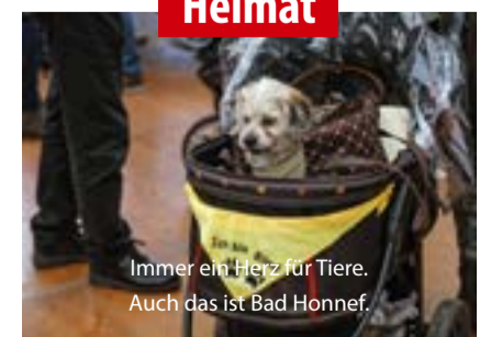
Immer ein Herz für Tiere. Auch das ist Bad Honnef.

Bad Honnefer Zeitung Redaktion: info@badhonnefer-zeitung.de