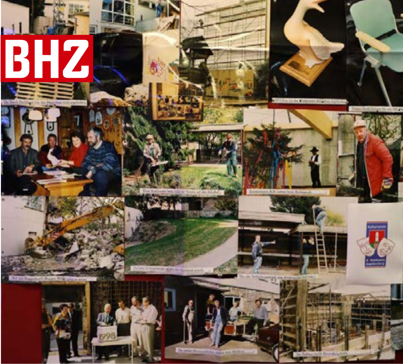
Links: Fotocollage von der Entstehung des Bürgerhauses Unten: Der gemischte Chor „Aegidienberger Stimmen“.